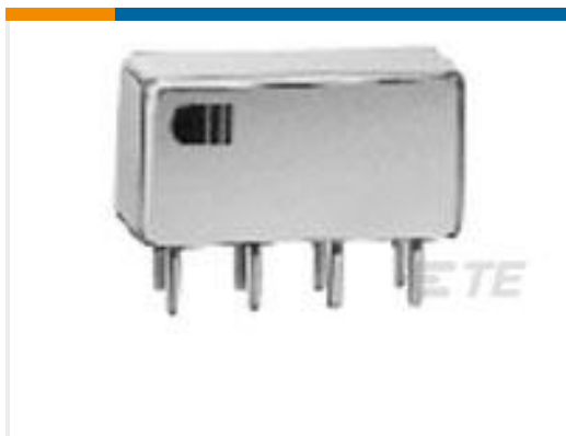
TE 产品编号1617030-2 HFW1201B00 = HFW 1/2 SIZE RELA