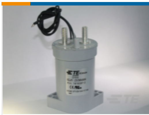
TE 产品编号 7-1618387-1 LEV200A5ANA=RELAY, SPST-NO