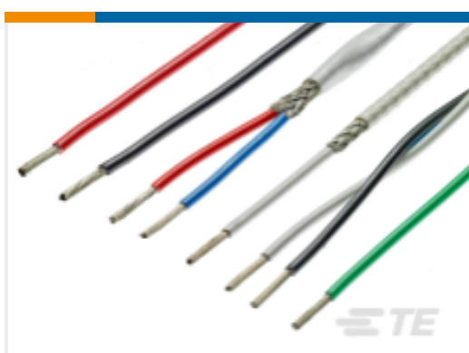
TE 产品编号265790-000 81044/9-10-2