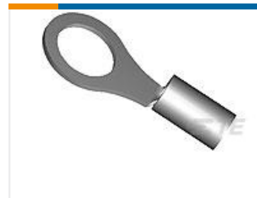
TE 产品编号34822 TERMINAL,PG R 16-14HD 8