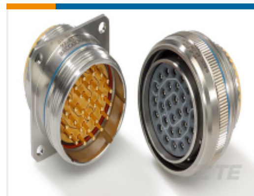
TE 产品编号ZPF000000000007383 983-05 16-10 SN