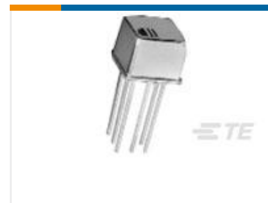
TE 产品编号1617145-1 JMGAC-12M = M39016/17-034M