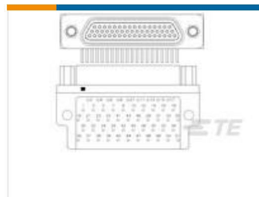
TE 产品编号1532264-2 M83513/14-G01CP = MCKS-C2-P-51SRT1