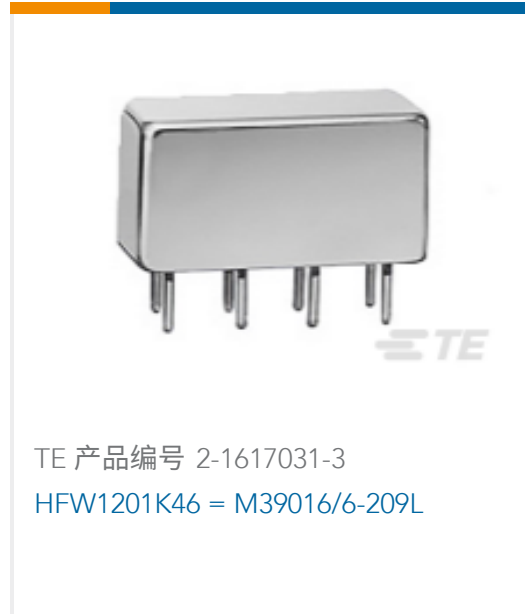
TE 产品编号 2-1617031-3 HFW1201K46 = M39016/6-209L