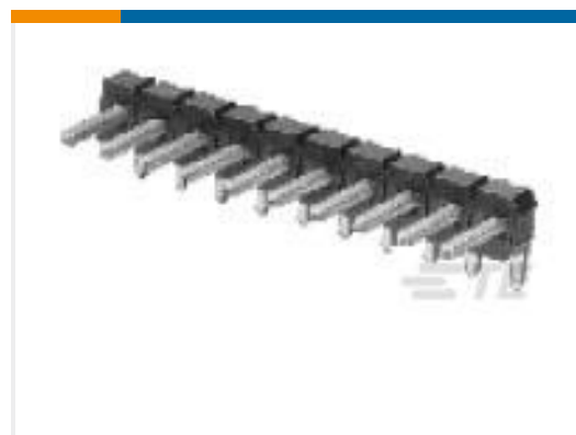
TE 产品编号103329-6 06 MODII HDR SRRA B/A .100CL