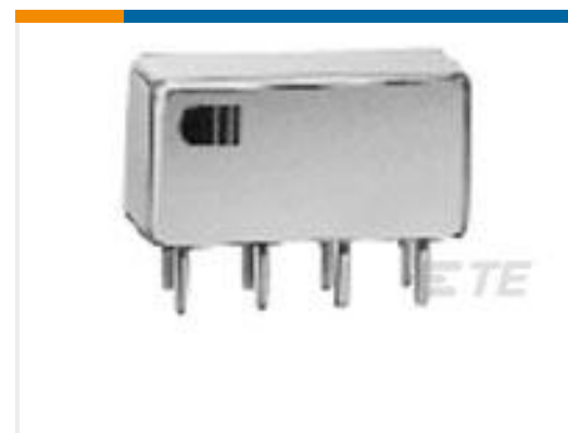
TE 产品编号2-1617031-1 HFW1201K45M = M39016/6-109M