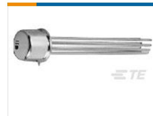
TE 产品编号3-1617108-2 PRMAC-26X=PRMA COTS TO-5 RELAY