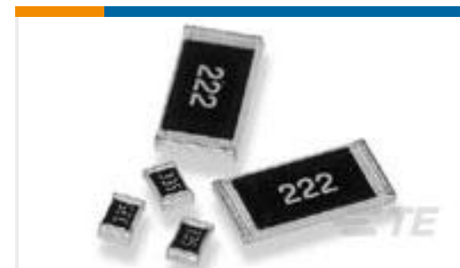
TE 产品编号9-1879510-1 CRGH0805 1% 10K 0.33W