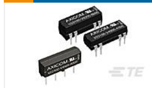
TE 产品编号1393763-6 V23100V4012A