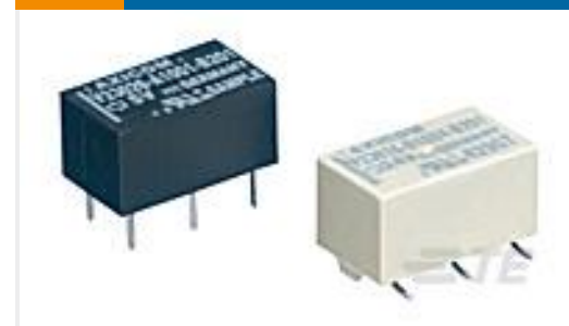
TE 产品编号1-1393774-0 V23026A1003B201