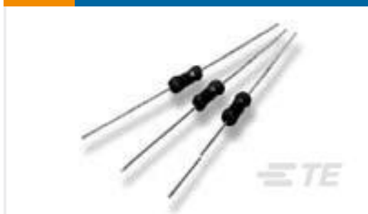
TE 产品编号1-1625892-0 3W SM M/OX 5% 10K