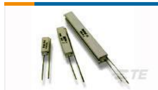
TE 产品编号1-1623729-6 BCHE 17 W 330R 5%