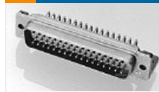
TE 产品编号1218441-4 R/A PLG ASSY 37 POS SER 109