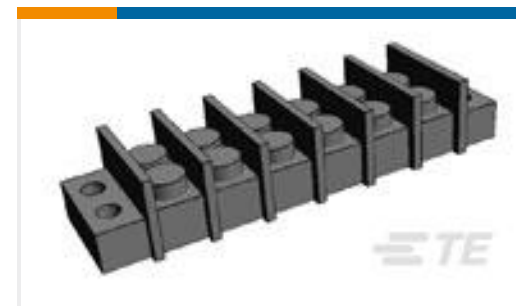
TE 产品编号1546306-6 6P .374" DR BARRIER STRIP