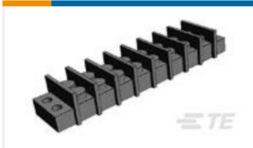
TE 产品编号1546306-8 8P .374" DR BARRIER STRIP