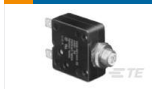
TE 产品编号1393249-5 W58-XB1A4A-1=W58