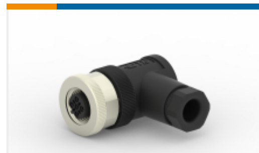
TE 产品编号T4112401041-000 M12,FEMALE,RA,B CODE,4P,PG7, GOLD