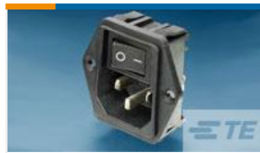
TE 产品编号1-1609112-2 15CE1=F8272