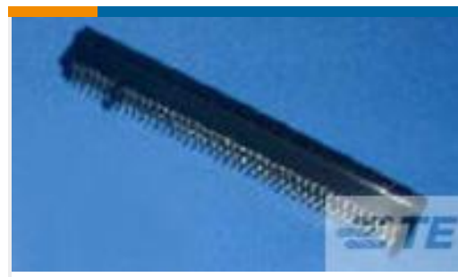
TE 产品编号9-1734774-5 PCI EXP 2.3L 98 POS BLK 30u"