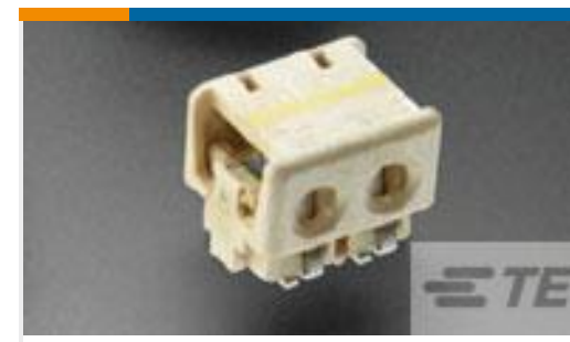
TE 产品编号1-2106431-2 Connector, SMT-IDC PASS THRU, 2 POS, 20