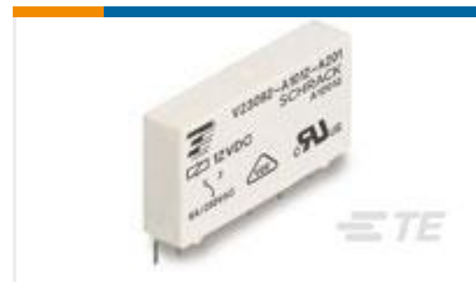
TE 产品编号1393236-4 V23092-A1012-A201