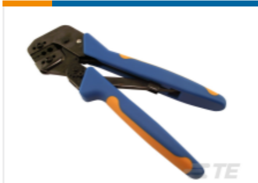
TE 产品编号318452-1 PROCrimp HT & DIE, COMM BNC