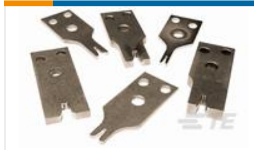
TE 产品编号456413-6 CRIMPER WIRE .220F