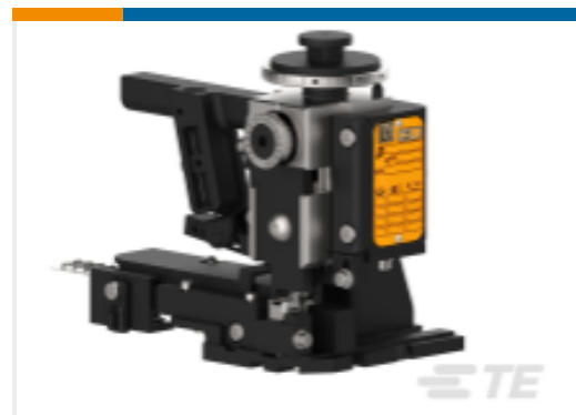
TE 产品编号2836862-1 OCEAN_2.0_APPLICATOR-S-070F124O