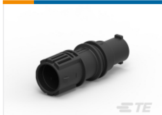
TE 产品编号DTSK04-1-08PB RECEPTACLE, INLINE, KEY B