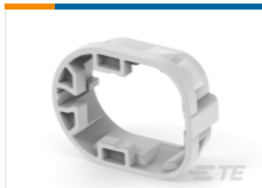
TE 产品编号2325098-4 MNTG CLIP, ENETSEAL PLUS