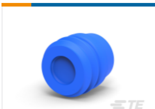
TE 产品编号2289241-1 WS-25-001, SEAL, BLU, 8.17-9.66, DTSK