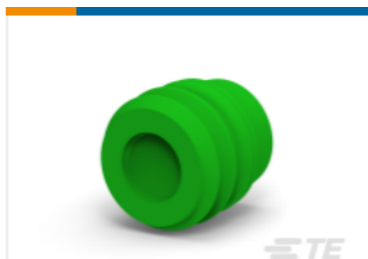
TE 产品编号2289243-1 WS-35-001, SEAL, GRN, 10.59-11.59, DTSK