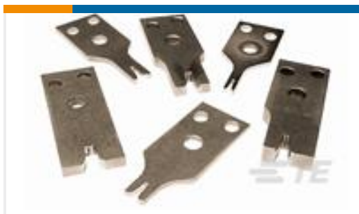
TE 产品编号1633511-7 CRIMPER, INSULATION "F"