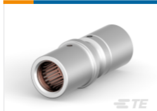
TE 产品编号SRK-SC-080-32-601 SOC, SOLID, SIZE M8, 32mm2, AG