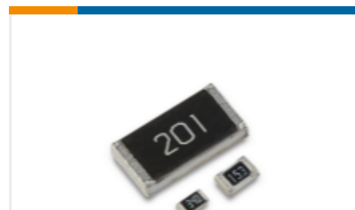
TE 产品编号1-2176326-8 CRGP 0603 270R 1%