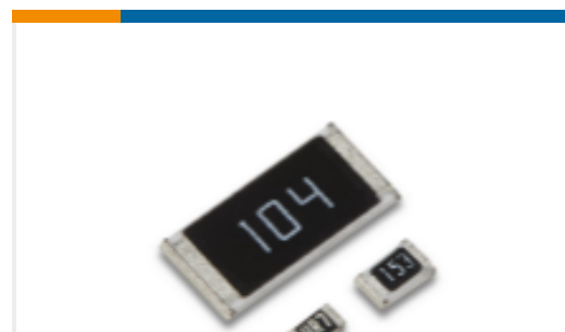
TE 产品编号1-2176345-2 CRGCQ 1210 82R 1%