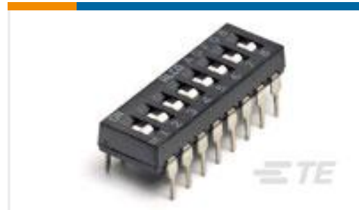
TE 产品编号1-1825002-4 ADF08T04=DIP SWT,FLUSH,THRU/HL