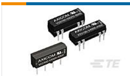
TE 产品编号1-1393763-2 V23100V4015A 10