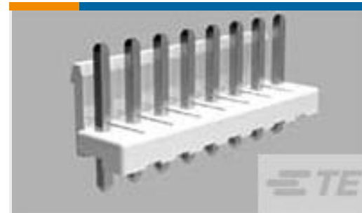
TE 产品编号1-1123723-5 3.96 EP HDR ASSY 5P(NATURAL)