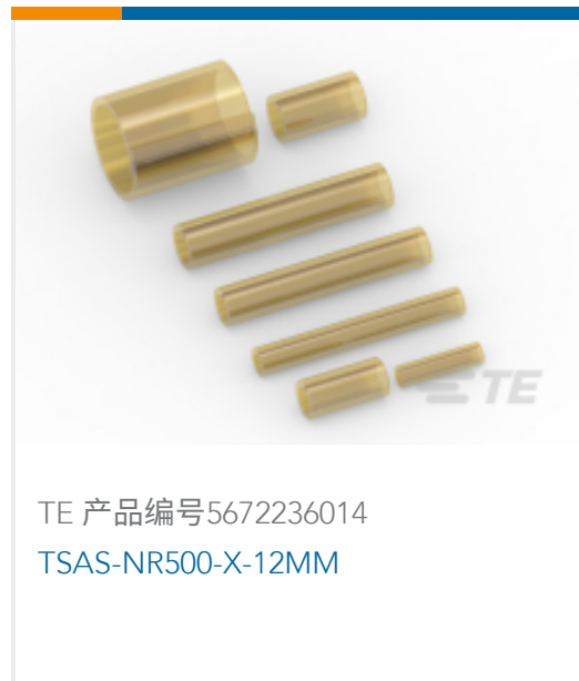
TE 产品编号5672236014 TSAS-NR500-X-12MM