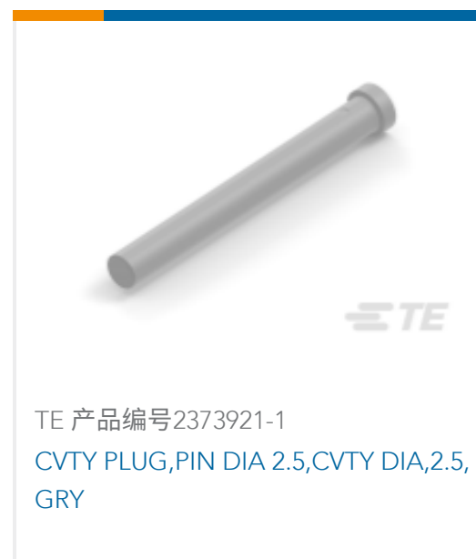
TE 产品编号2373921-1 CVTY PLUG, PIN DIA 2.5, CVTY DIA, 2.5, GRY