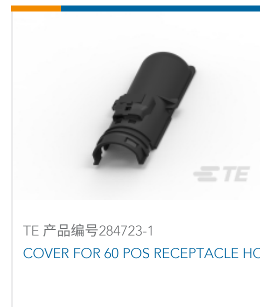
TE 产品编号284723-1 COVER FOR 60 POS RECEPTACLE HO