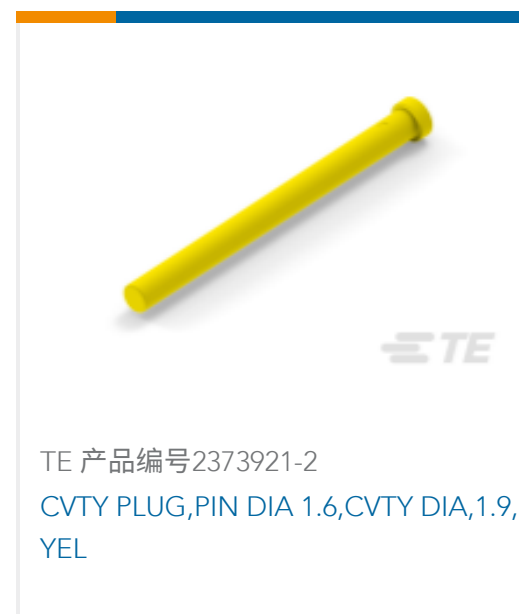
TE 产品编号2373921-2 CVTY PLUG, PIN DIA 1.6, CVTY DIA, 1.9, YEL