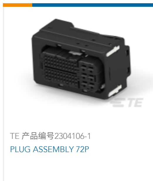
TE 产品编号2304106-1 PLUG ASSEMBLY 72P