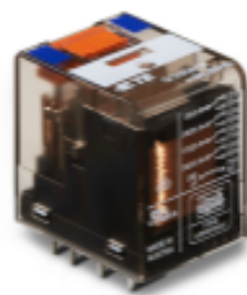
TE 产品编号 9-1419111-3 PT571024