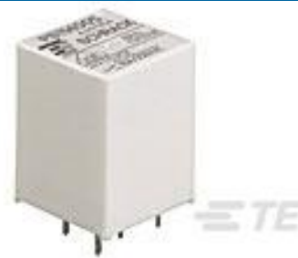
TE 产品编号 3-1415030-1 PB134024