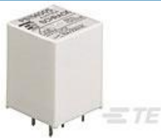
TE 产品编号 2-1415030-1 PB134012