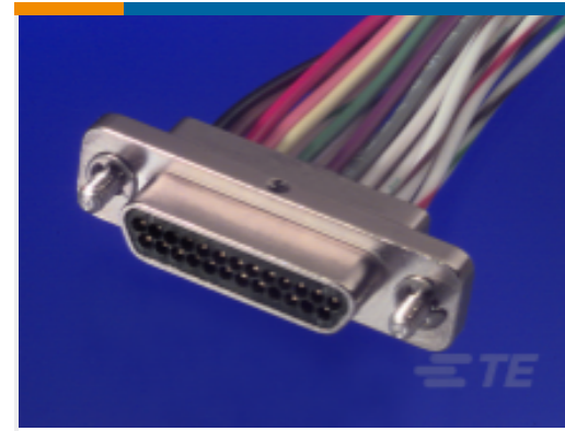
TE 产品编号2-1532179-4 M83513/03-A08C, MCKS-C2-B-9P5L5- 1.0