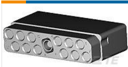
TE 产品编号1604800-8 ASSY,PLUG,FREE HANGING,12 POS, W/HDWE