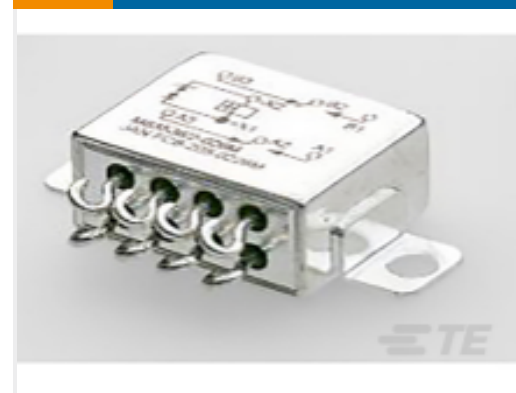
TE 产品编号9-1617784-2 FCB-205-0117M=M83536/1-017M