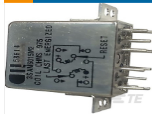
TE 产品编号2-1617514-5 3SAT1322A2=M5757/13-105