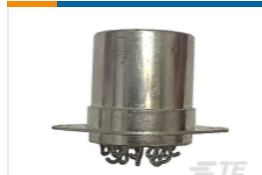
TE 产品编号1617048-6 RD6CA2600 = M5757/1-026