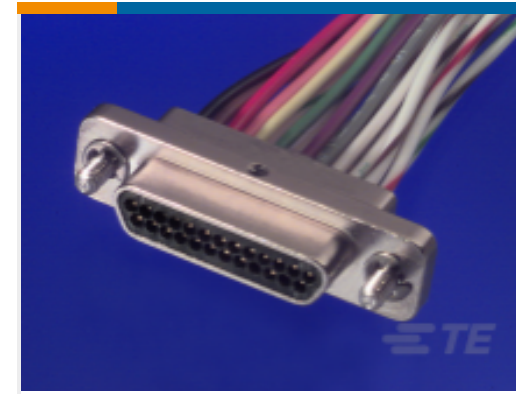
TE 产品编号2-1532186-9 M83513/03-H12C, MCKS-C2-B- 100P6Q9-36.0