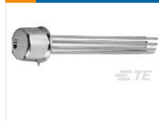
TE 产品编号1617162-9 J1MACT-26XPS = M28776/5-036P