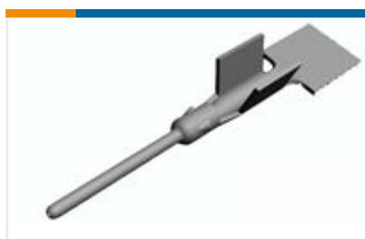
TE 产品编号1438890-7 PIN CONTACT, JACK, 180 DEGREE, SMB