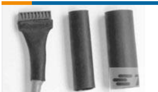
TE 产品编号CX0364-000 DWP-125-1-2-55MM