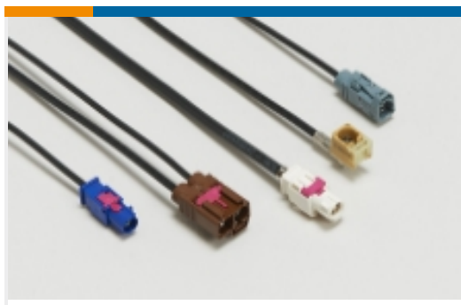
信息娱乐和多媒体线束(1)