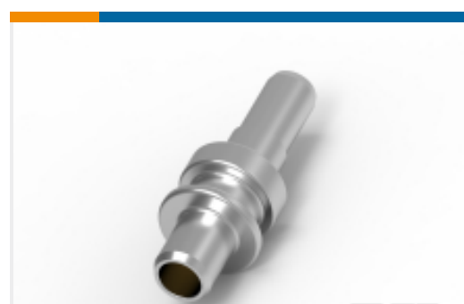
TE 产品编号1438910-1 JACK SUBASSEMBLY, RG-58 AND RG-58LL, 180