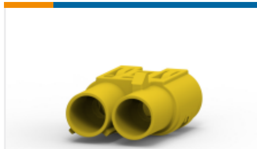
TE 产品编号1-1924855-0 JACK HOUSING, 2 POSN, FAKRA, Key K