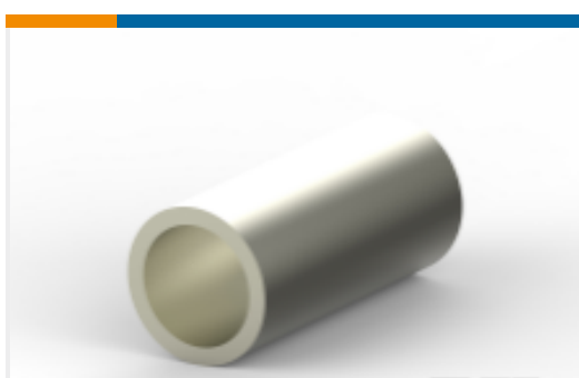
TE 产品编号1-413889-4 FERRULE,NI PLTD