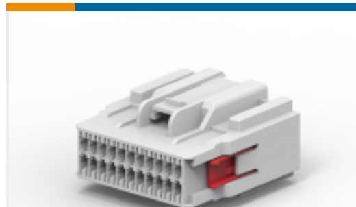
TE 产品编号1-2208018-2 22POS,0.64 MALE GEN. Y,PIN HSG, ASSY