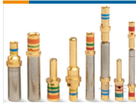
TE 产品编号ZPF000000000003649 724-8021-22