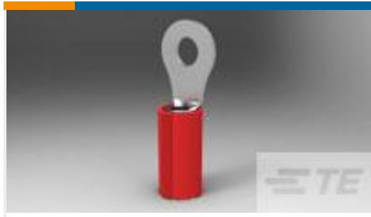
TE 产品编号132250-2 TERMINAL RING TONGUE PIDG 20 AWG