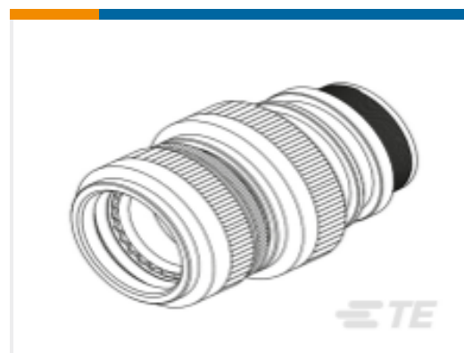
TE 产品编号A76929-000 STXR40AB00-2422AI