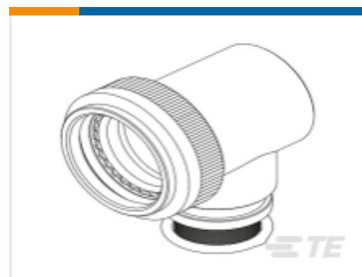
TE 产品编号306939-000 TXR40BW90-1408AI