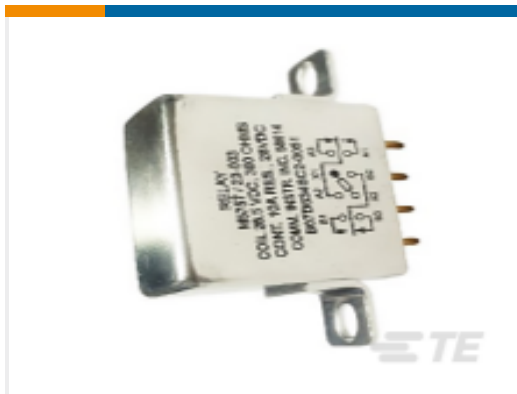
TE 产品编号1617002-6 B07A112BB1 = RELAY.