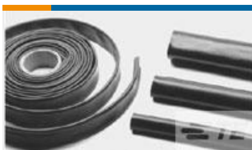
TE 产品编号CB5444-000 XFFR-30X25