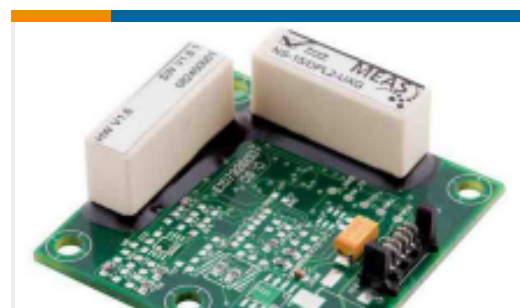
TE 产品编号G-NSDPL2-003 NS-15/DPL2-UXG