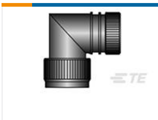
TE 产品编号CA8086-000 HEX40-AB-90-09-A1-2