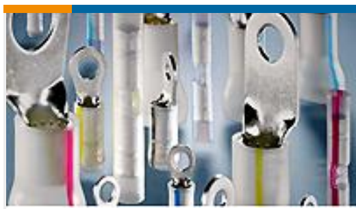
TE 产品编号696423-9 TERMINAL,PIDG PVF2 R 16-14 3/8