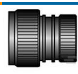
TE 产品编号133119-000 HEX61-AB-00-21-A9-1