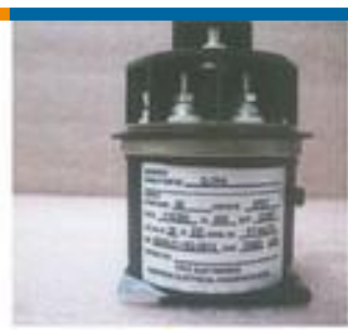
TE 产品编号1-1616933-6 D7PH=RELAY