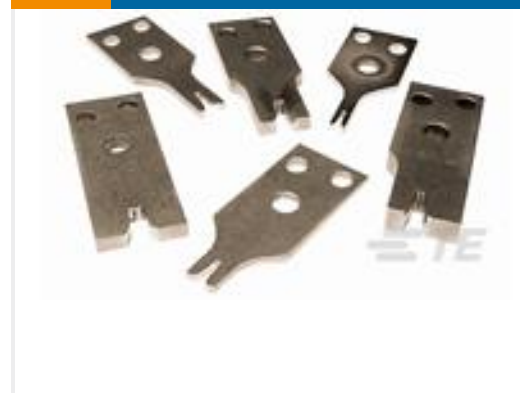
TE 产品编号 2-456401-4 CRIMPER, WIRE .042 F