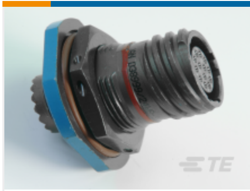
TE 产品编号 YDTS24Z13-35PAV001 RECP ASSY