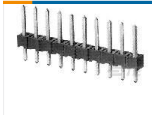
TE 产品编号 103327-8 08 MODII HDR SRST B/A .100CL