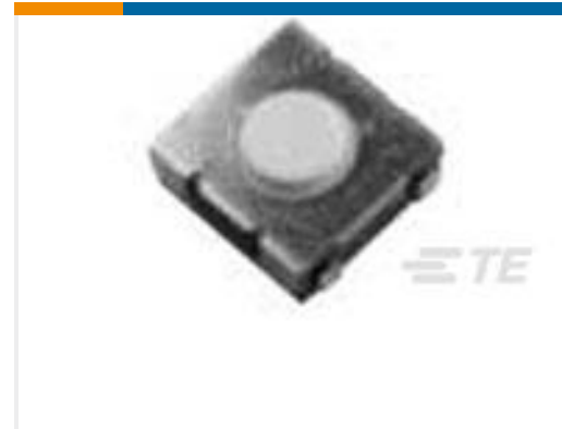
TE 产品编号 1571625-2 TACT,6X6,SMT,J-LEAD,50GF,T&R