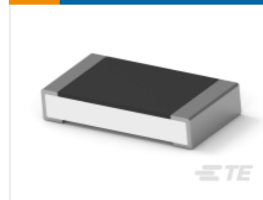
TE 产品编号 1-2176389-5 RQ 1206 150R 0.1% 10PPM 5K RL