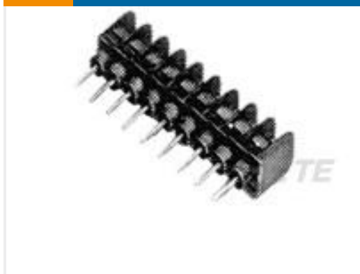
TE 产品编号 4-1437666-3 JC6-W408-03=JC6 ASSEMBLY