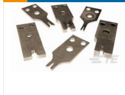
TE 产品编号 3-456402-0 CRIMPER, WIRE .055" F