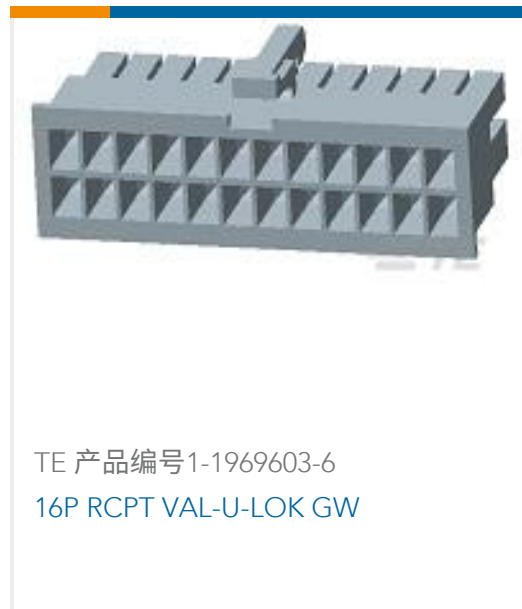
TE 产品编号1-1969603-6 16P RCPT VAL-U-LOK GW