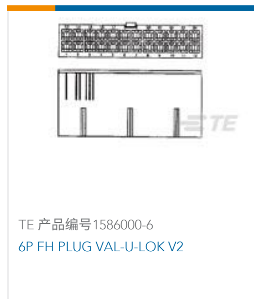
TE 产品编号1586000-6 6P FH PLUG VAL-U-LOK V2