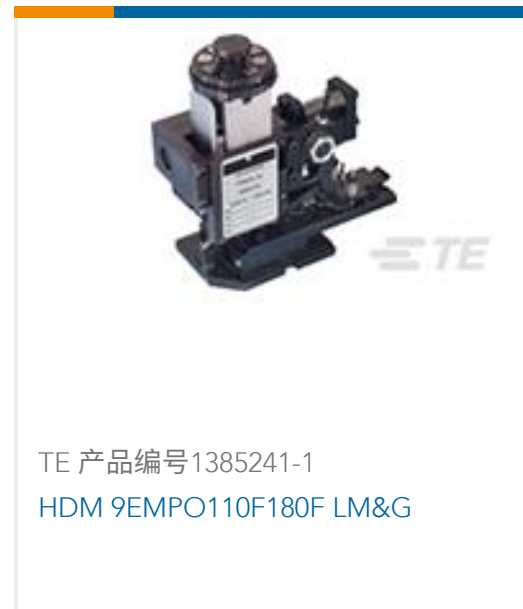
TE 产品编号1385241-1 HDM 9EMPO110F180F LM&G