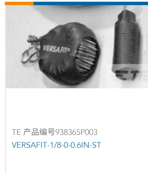
TE 产品编号938365P003 VERSAFIT-1/8-0-0.6IN-ST