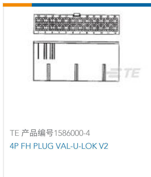
TE 产品编号1586000-4 4P FH PLUG VAL-U-LOK V2