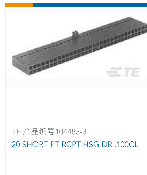
TE 产品编号104483-3 20 SHORT PT RCPT HSG DR .100CL