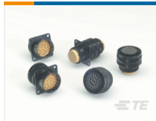
TE 产品编号ZPF00000000019324 FDBA 56-14-19 SW-K-A499