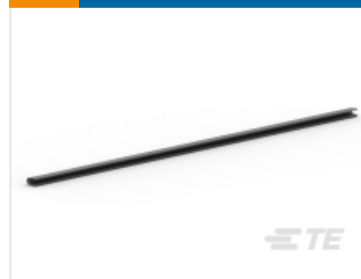
TE 产品编号5039572011 TPEM-NR7-0-STK