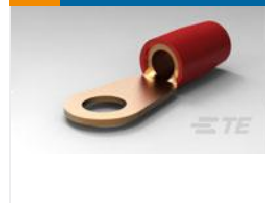
TE 产品编号324082 TERMINAL,T-N R 8 1/4