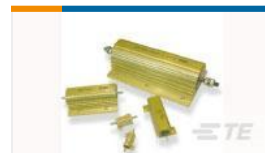
TE 产品编号3-1630027-2 HSC300 12R8 5%