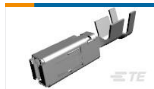
TE 产品编号1241390-2 AMP MCP 2.8K, CONTACT