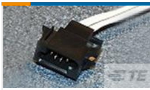
TE 产品编号 1489127-3 HDR HSG 5 CONTS BLKHD CONN