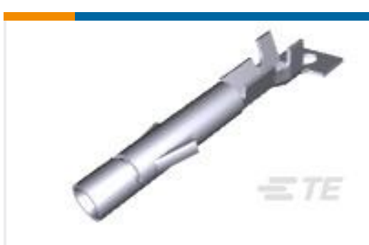
TE 产品编号926895-7 UNIVERSAL M-N-L SOCKET