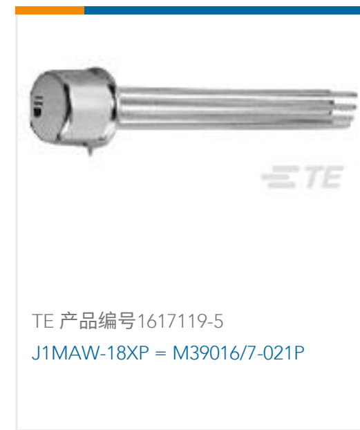
TE 产品编号1617119-5 J1MAW-18XP = M39016/7-021P