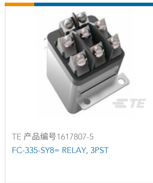
TE 产品编号1617807-5 FC-335-SY8= RELAY, 3PST