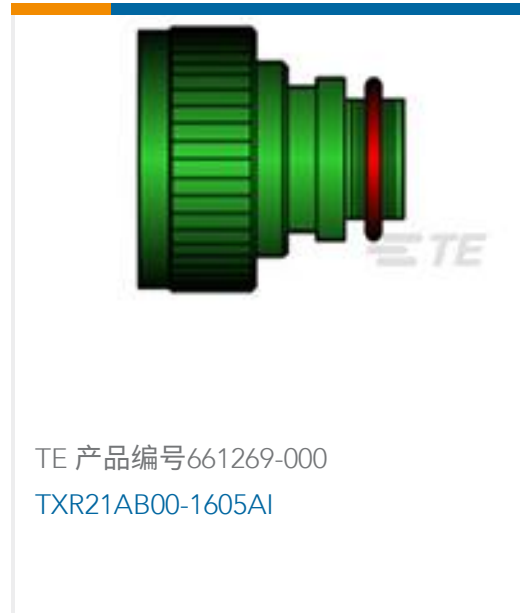
TE 产品编号661269-000 TXR21AB00-1605AI