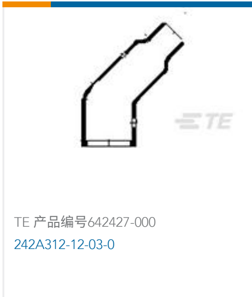
TE 产品编号642427-000 242A312-12-03-0