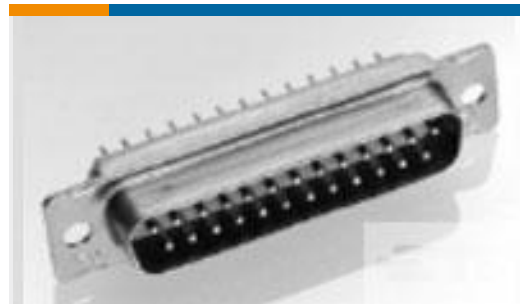
TE 产品编号1757819-7 AMPLIMITE,ASY,PLUG,STD,109,ZN,2,CT