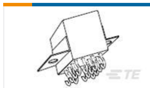
TE 产品编号2-1617754-3 FCA-410-1624M=M83536/16-024M