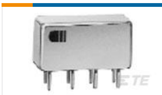
TE 产品编号1617037-9 HFW5A1201K00 = HFW 5AMP RELAY