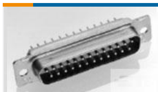
TE 产品编号1757823-9 AMPLIMITE,ASY,PLUG,STD,90,ZN,3,CT