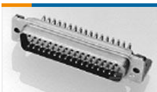
TE 产品编号1218444-3 R/A PLUG ASSY 25 POS SER 109