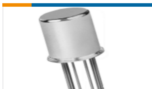
TE 产品编号2-1617351-2 JMSP-5XM=M39016/11-018M