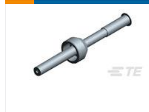
TE 产品编号 867726-1 VRL-1L DBL ENDED LEAD ASSY