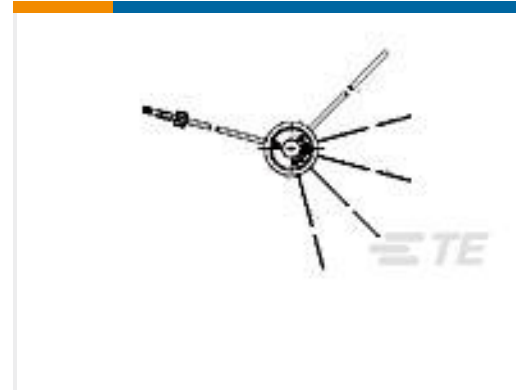
TE 产品编号 867121-1 12 POS TUBE BASE & FLY LEADS