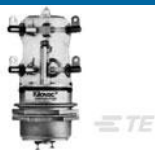
TE 产品编号 1-1618273-5 H-16C=RELAY, VACUUM, DPDT