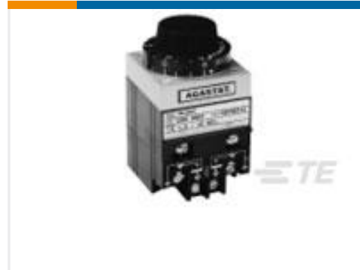
TE 产品编号 1-1423183-2 7032CCB=RLY,STD,DBH,2P,480VAC,