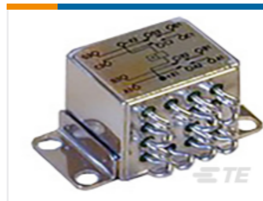
TE 产品编号 1-1617787-0 FCB-405-0520L=M83536/5-020L