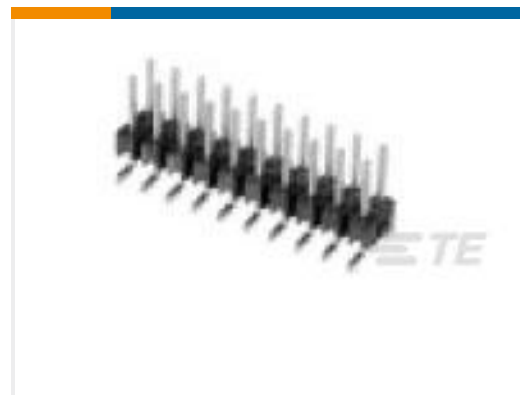
TE 产品编号 147279-4 04 MODII HDR DR SFMT B/A T&R