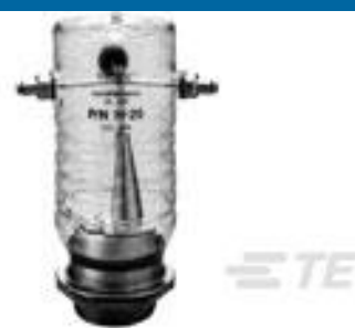
TE 产品编号 6-1618273-5 H-25=RELAY, VACUUM, SPDT