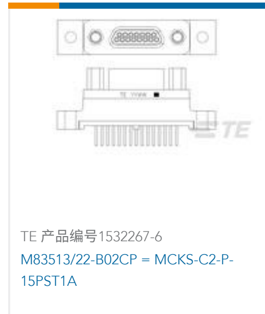
TE 产品编号1532267-6 M83513/22-B02CP = MCKS-C2-P-15PST1A