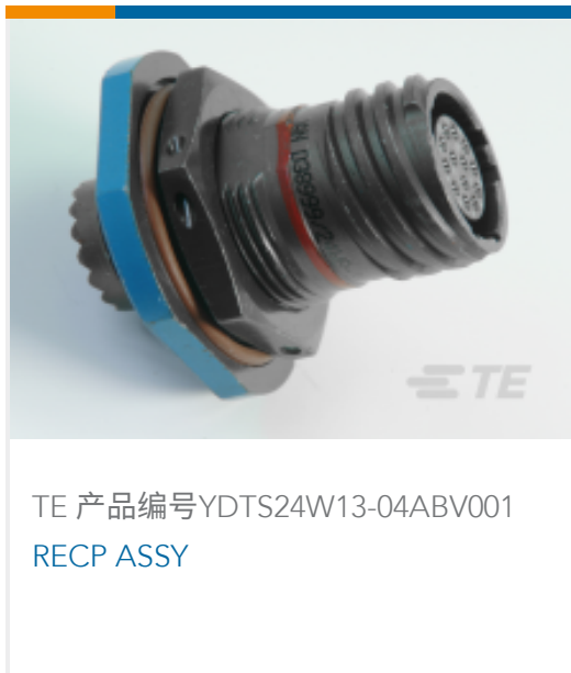
TE 产品编号YDTS24W13-04ABV001 RECP ASSY