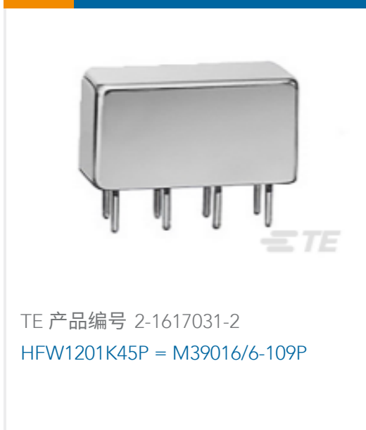
TE 产品编号 2-1617031-2 HFW1201K45P = M39016/6-109P