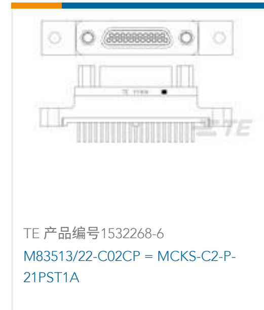
TE 产品编号1532268-6 M83513/22-C02CP = MCKS-C2-P-21PST1A