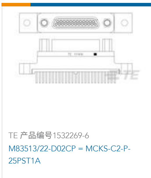
TE 产品编号1532269-6 M83513/22-D02CP = MCKS-C2-P-25PST1A