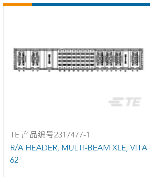
TE 产品编号2317477-1 R/A HEADER, MULTI-BEAM XLE, VITA 62