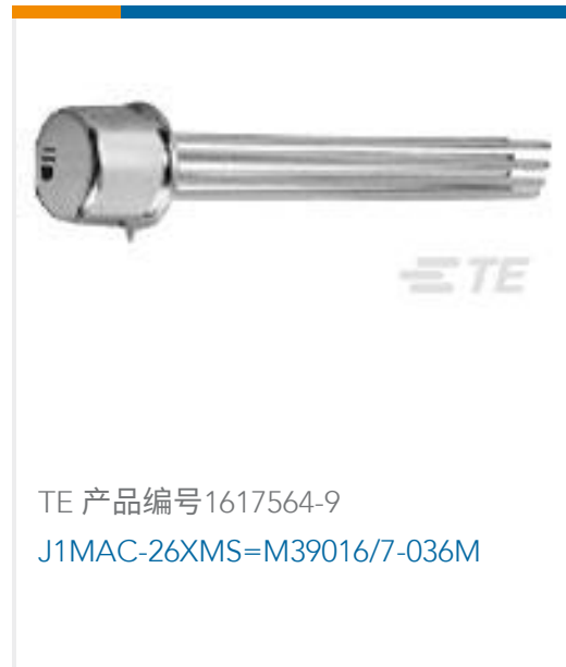
TE 产品编号 1617564-9 J1MAC-26XMS=M39016/7-036M