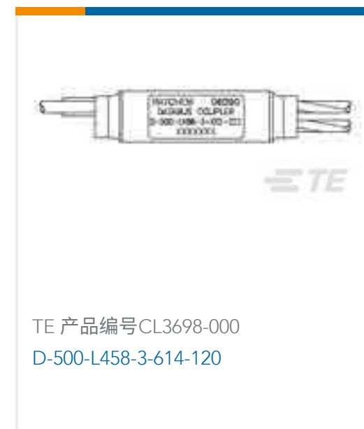
TE 产品编号CL3698-000 D-500-L458-3-614-120