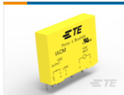
TE 产品编号 9-1393028-0 SLIM INPUT AC MOD,15V DC LOGIC-24VAC IP