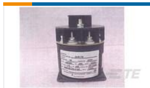
TE 产品编号1-1616037-6 DHR7B=CONTACTOR - 3PDT