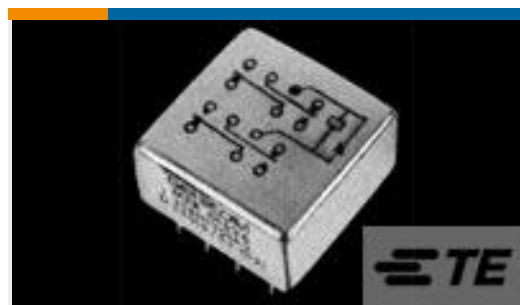
TE 产品编号2-1617076-5 3SBH1230A2 = M39016/53-011M