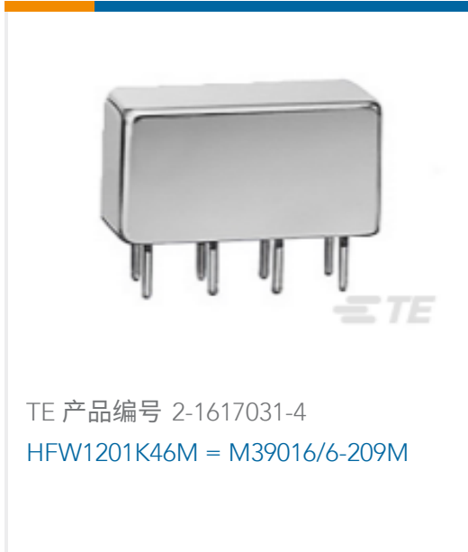
TE 产品编号 2-1617031-4 HFW1201K46M = M39016/6-209M