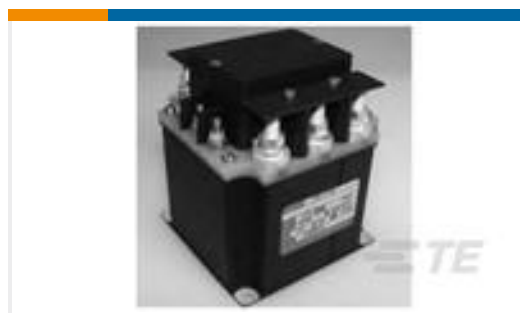
TE 产品编号1616021-6 SA136A=CONTACTOR 3PST N.O. 75