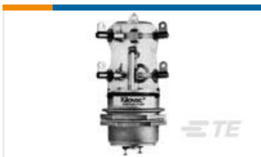
TE 产品编号1-1618273-5 H-16C=RELAY, VACUUM, DPDT