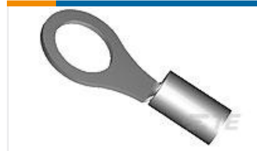
TE 产品编号30926 TERMINAL,DG R 16-14 6