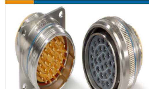
TE 产品编号ZPF000000000009054 983-6SE 28-42 PN