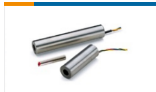
TE 产品编号10204363-00 LVDT HR-Z 500 ASSY