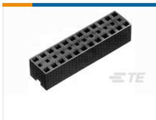
TE 产品编号390102-1 SHUNT, MULTI-POS 2X2 W/HANDLE