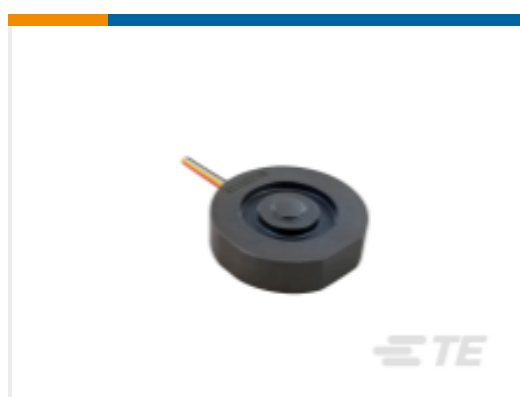
TE 产品编号20009605-09 FX293X-040B-0025-L