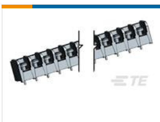
TE 产品编号4-1437658-0 8PCV-11-006=8PCV