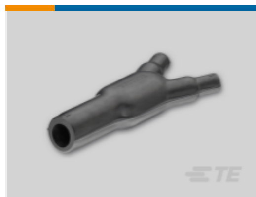
TE 产品编号163549-000 382A034-25/42-0