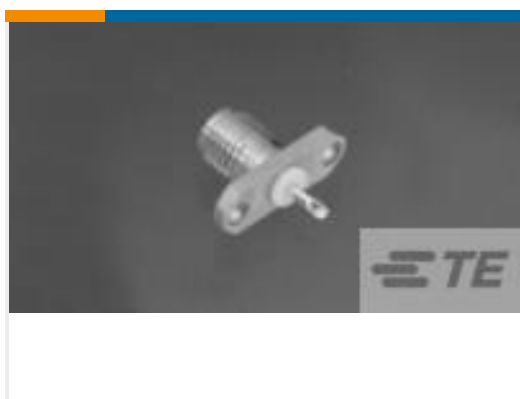
TE 产品编号1052928-1 2052 8003 92