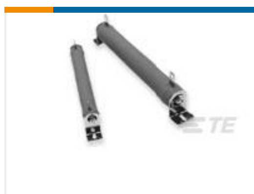
TE 产品编号3-1879447-2 TE 200W 390R 5% Bracket