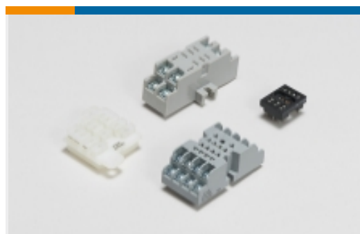
继电器附件、插座和卡笼(3)