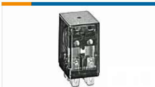
TE 产品编号 5-1393144-9 K10P-11D15-48=K10/K20