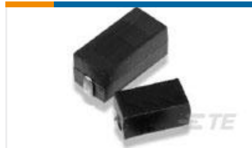
TE 产品编号1-1879233-7 SMW5 R47 5%