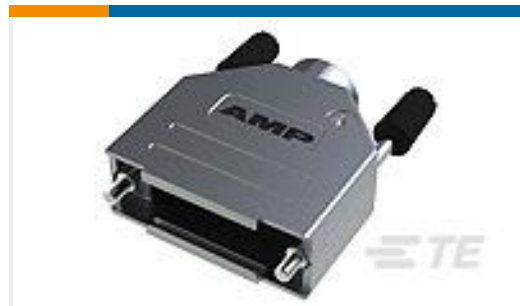
TE 产品编号1-1478762-5 METAL BACKSHELL 15 WAY TOP E