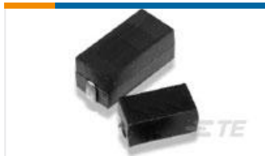
TE 产品编号1-1879233-9 SMW5 R56 5%