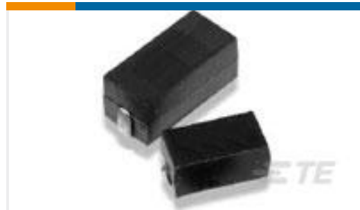
TE 产品编号1-1879233-6 SMW5 R43 5%