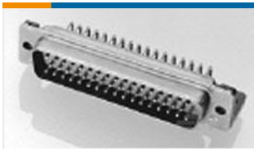
TE 产品编号1218434-4 R/A RCP ASSY 37 POS SER 109