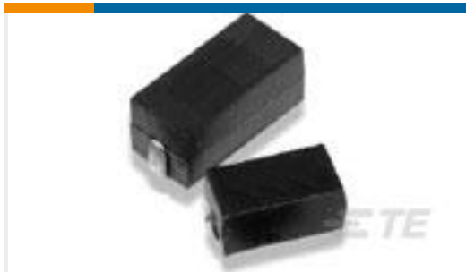
TE 产品编号1-1879233-4 SMW5 R36 5%