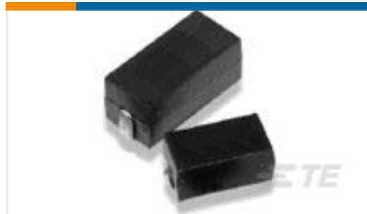
TE 产品编号1-1879233-5 SMW5 R39 5%