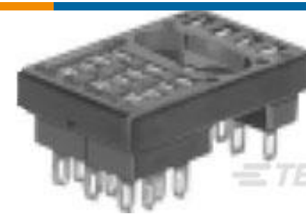
TE 产品编号 2-1393143-4 27E212=SOCKET,R10,10,PC,PHEN