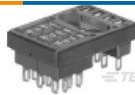
TE 产品编号 1-1393143-1 27E128=SOCKET,R10,10,PC,PHEN