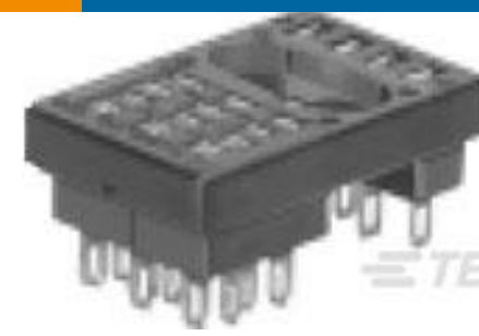
TE 产品编号 3-1393143-4 27E317=SOCKETS