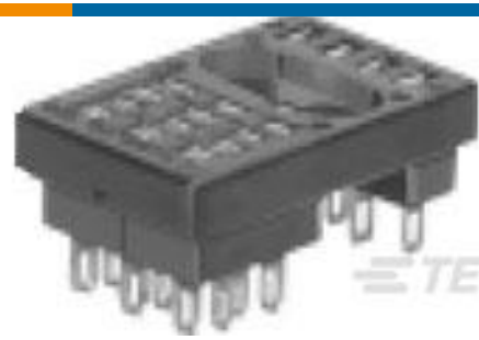
TE 产品编号 1393143-8 27E125=SOCKET,R10,10,SLG,PHE