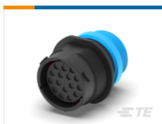
TE 产品编号HDP24-24-16SE-L015 REC, 16P, BLK, E, THD, 12, S