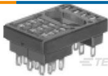
TE 产品编号 5-1393143-0 27E636=SOCKETS