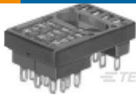
TE 产品编号 2-1393143-1 27E193=SOCKET,R10,11,PC,PHEN