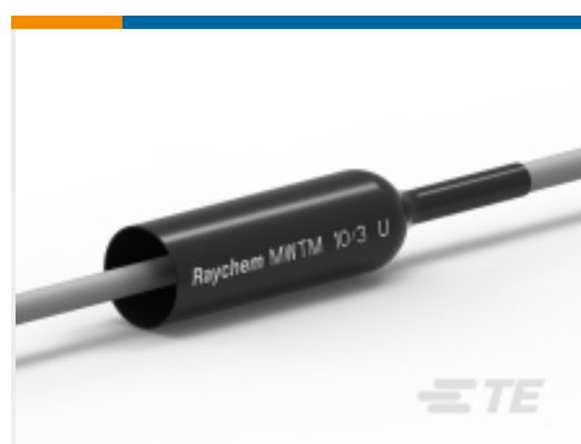
TE 产品编号834936-000 MWTM-10/3-100/S(S100)