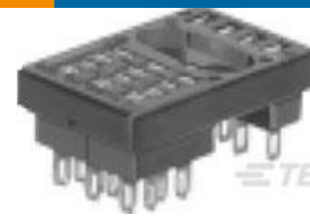
TE 产品编号 3-1393143-6 27E342=SOCKETS