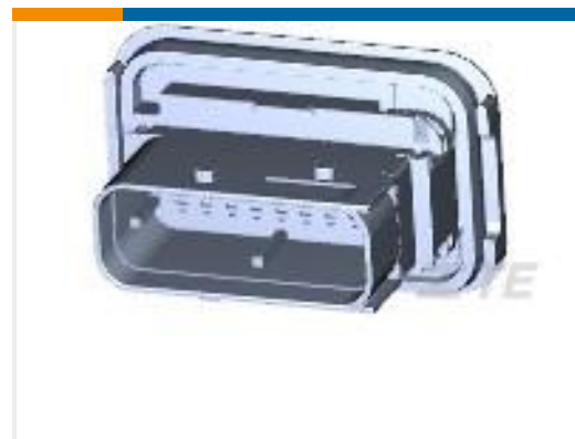
TE 产品编号2-1564532-1 15POS, MIXED,TAB HSG,ASSY