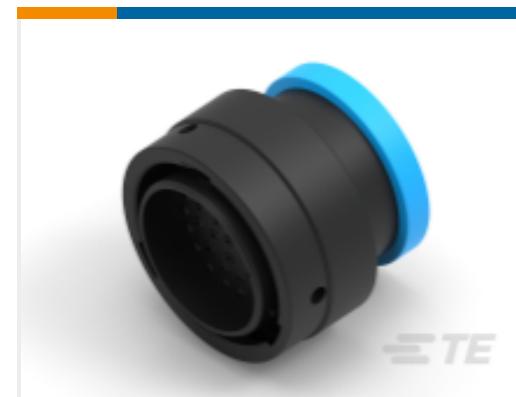
TE 产品编号YHDP26-24-35PEL017 PLG, 35P, BLK, E, RNG, 16/20, P