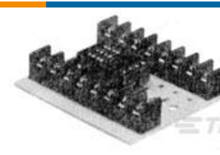
TE 产品编号 1393837-1 27E460=SOCKET,R10,,ASSY,2 POLE