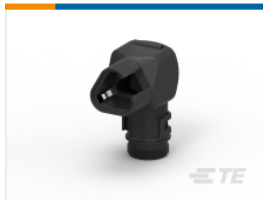
TE 产品编号1011-232-0305 BKSHL, 3P, BLK, PLG, RA, NW6/7.5/8.5 /10