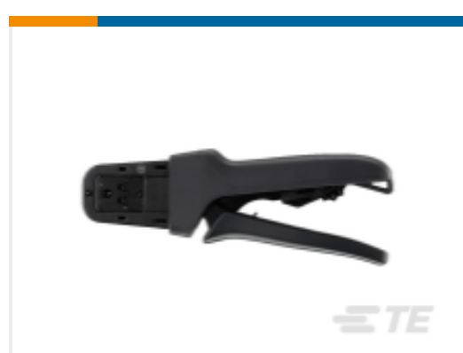
TE 产品编号DTT-20-03 CRIMP TOOL