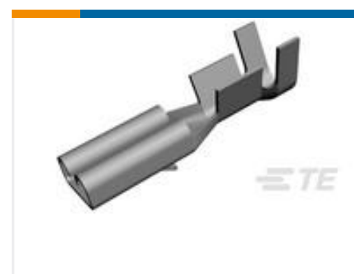
TE 产品编号160668-6 TERMINAL