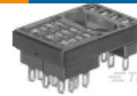
TE 产品编号 4-1393143-1 27E446=SOCKETS