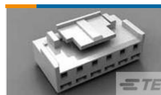
TE 产品编号1-1123722-2 3.96 EP PLUG HSG 2P(NATURAL)