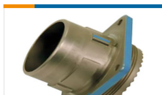
TE 产品编号YDIV40E13-98PNV001 RECP ASSY