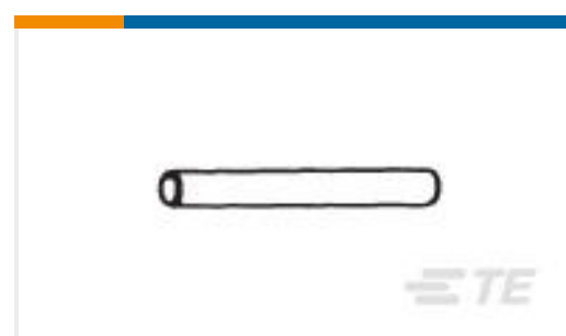
TE 产品编号1445886-5 RET PIN,15/30/45A,SP,2 HIGH