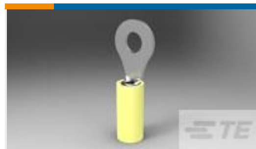
TE 产品编号2-35149-1 TERMINAL,PIDG R 12-10 6