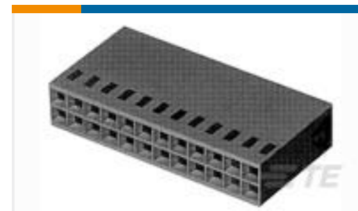
TE 产品编号2-87456-2 26 MODIV HSG DR MRKD .100CL