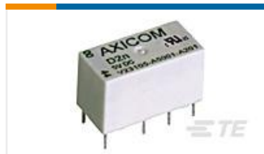
TE 产品编号1393793-8 V23105A5403A201