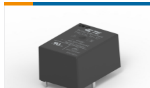
TE 产品编号1558662-7 T9GV2L14-24