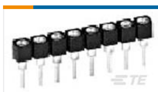
TE 产品编号2-1437535-9 510-AG91D-10=INLINE SOCKET ASS