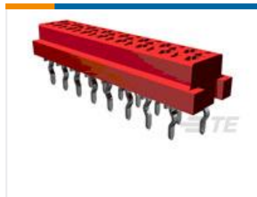
TE 产品编号8-215079-0 MICRO-MATCH FOB.10P