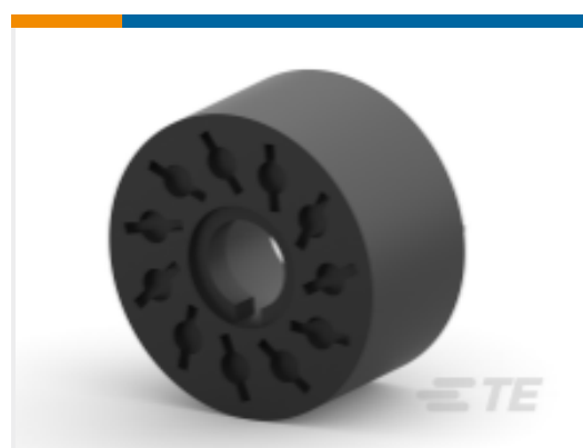
TE 产品编号1415044-1 MT78603