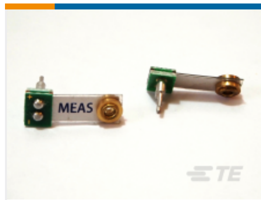
TE 产品编号1005939-1 LDTC - Horizontal