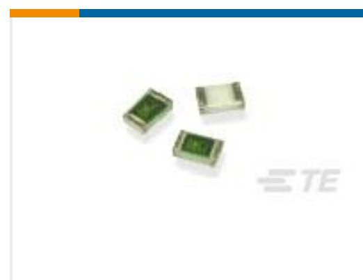
TE 产品编号1676172-2 RN 0805 12K1 0.1% 10PPM 1KRL