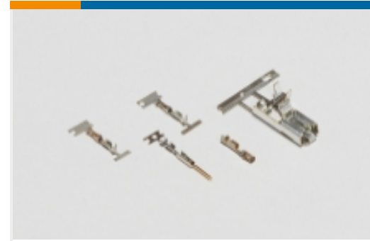
线对板连接器端子(66)