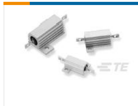
TE 产品编号1-1879073-0 THS10 1R0 5%