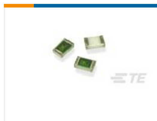
TE 产品编号1676335-2 RN 0805 40K2 0.1% 10PPM 1KRL