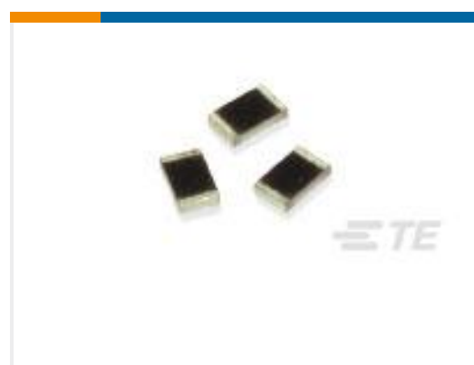
TE 产品编号1625856-8 RH73 2A 50M 10% 100PPM