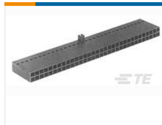
TE 产品编号104483-5 30 SHORT PT RCPT HSG DR .100CL