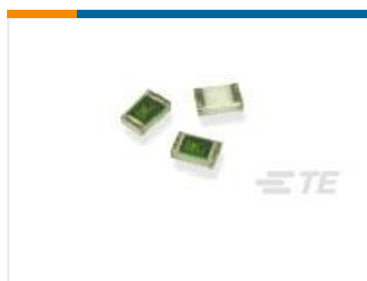
TE 产品编号1676258-2 RN 0805 22K6 0.1% 10PPM 1KRL