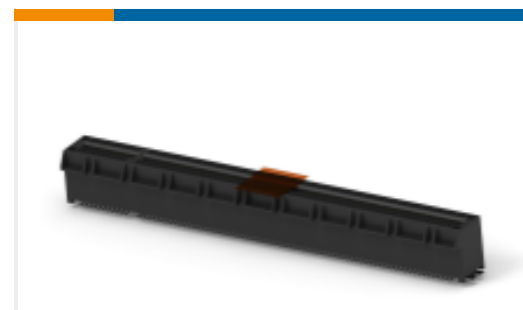
TE 产品编号 5-2337939-4 PCIE GEN4 CON,SMT,164POS,30u", MYLAR,HT