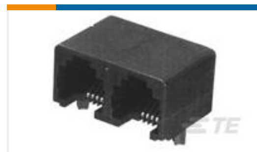
TE 产品编号1734479-4 RJ11 6P4C,1x2ports,Dip,4P,Black,50u" AU