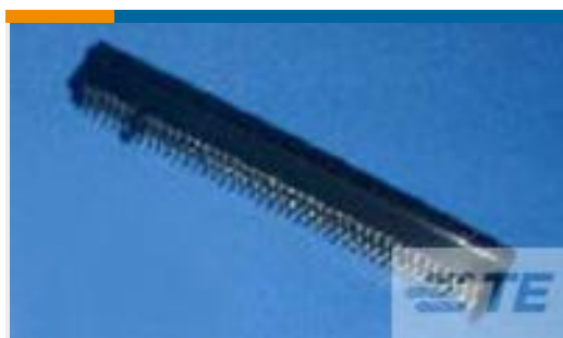
TE 产品编号 1734774-1 PCI EXP 3.1L 36 POS WHT G/F