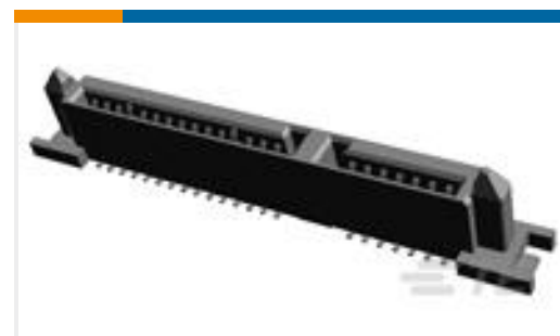
TE 产品编号1735284-1 SATA BACKPLANE RECEPTACLE, VERTICAL, SMT