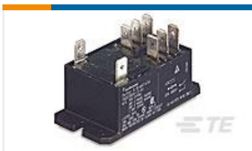
TE 产品编号9-1393211-3 T92S11D22-12