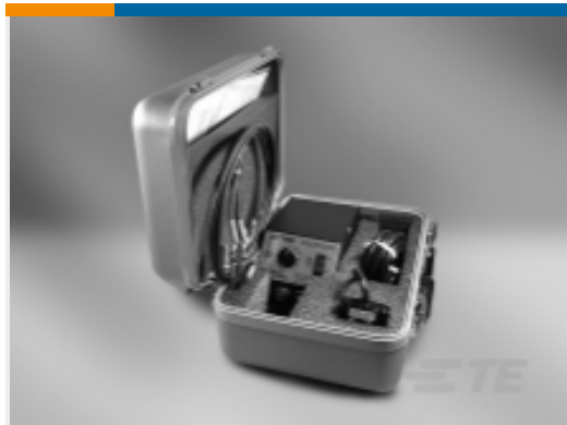
TE 产品编号 173643-000 RH-3960-1-TINEL-KIT-120V