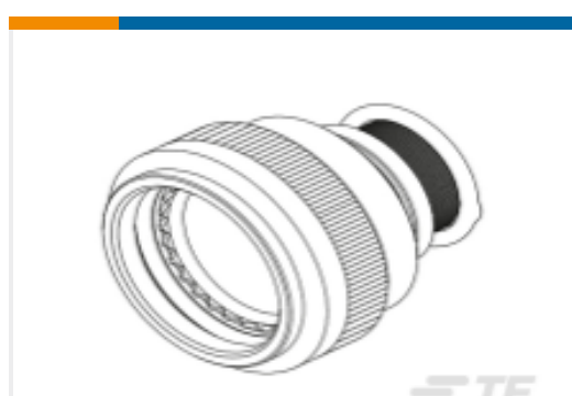
TE 产品编号855399-000 TXR40BW00-2008AI