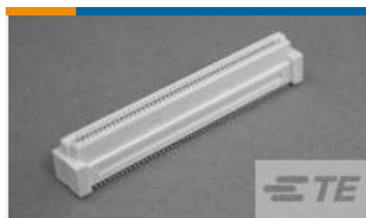
TE 产品编号5-5179232-5 0.8FH,R09H.5,120,08/Sn,TU,SC