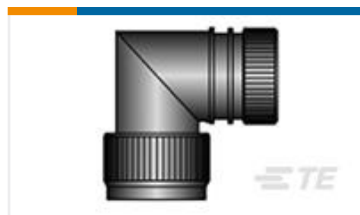
TE 产品编号564916-000 HEX40-AB-90-09-A1-1