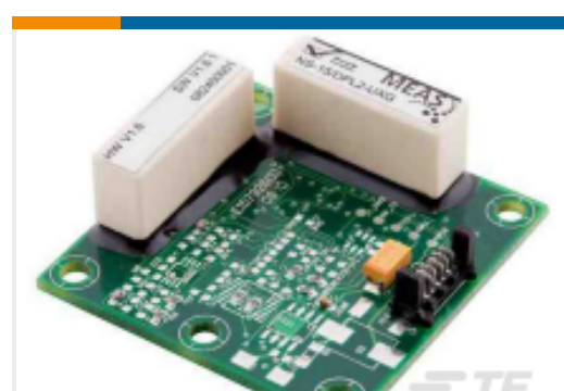
TE 产品编号G-NSDPL2-003 NS-15/DPL2-UXG