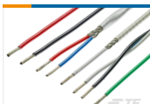
TE 产品编号3839253002 44A1121-24-0/1-9