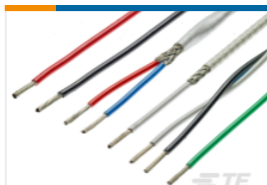
TE 产品编号C67553-000 44B1811-12-9-9CS2275