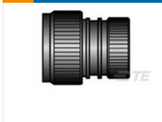
TE 产品编号F04540-000 HEX40L-AB-00-23-A13-1