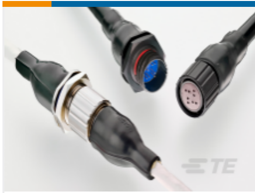
TE 产品编号2102453-1 CeeLok FAS-T, Recept Assy PCB, Sq, Ni