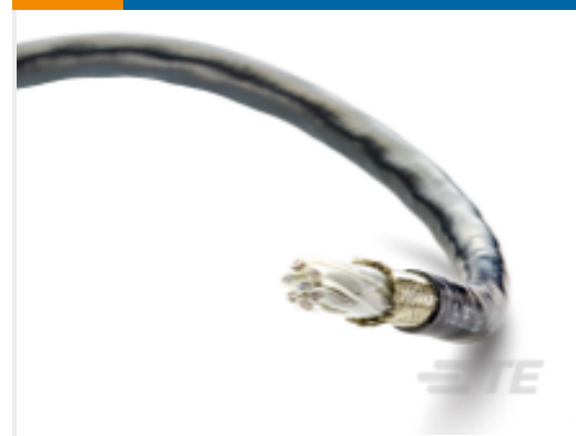
TE 产品编号D023543001 VG-95218-T028-C032CK3100