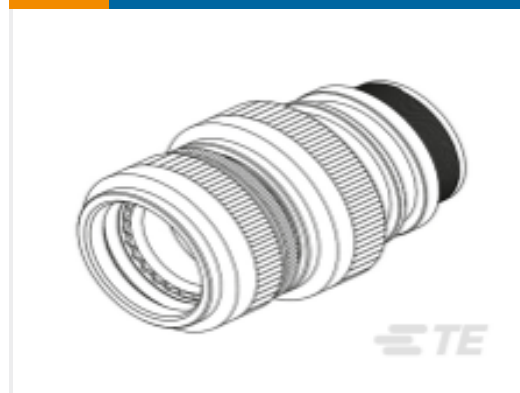
TE 产品编号A76929-000 STXR40AB00-2422AI