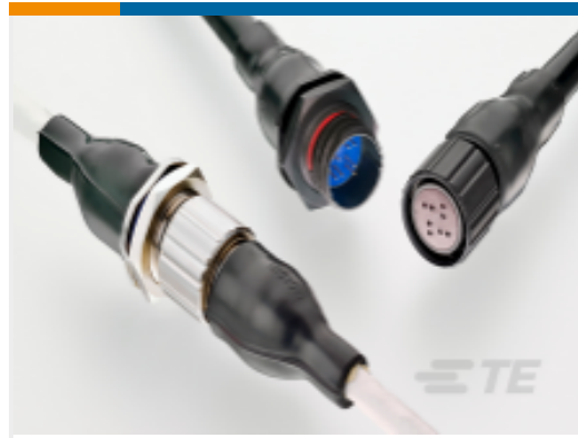
TE 产品编号2102453-3 CeeLok FAS-T, Recept Assy PCB, Sq, Ni, A