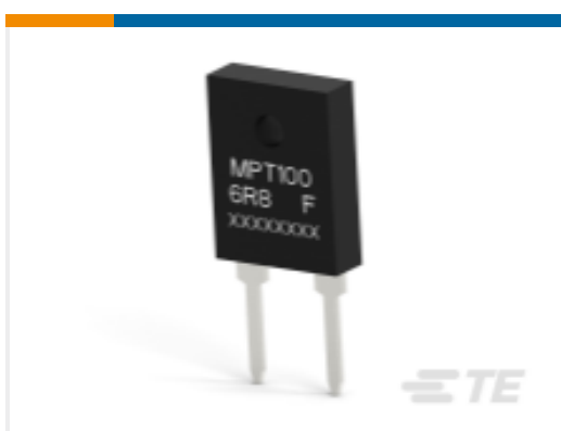
TE 产品编号2176429-5 MPT100 R47 5%