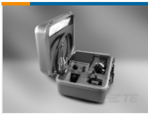
TE 产品编号 173643-000 RH-3960-1-TINEL-KIT-120V