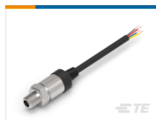
TE 产品编号20004013-00 PRESS XDCR M325P-00000E-025BG