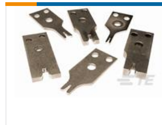
TE 产品编号2-456406-5 WIRE CRIMPER .090