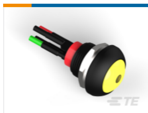
TE 产品编号1-2329389-1 PB OFF/ON FC YLW M1 TERM WHI LED IP68 50