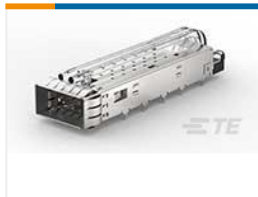
TE 产品编号2170773-1 CAGE ASSY, QSFP28 1X1, SPRING, LP