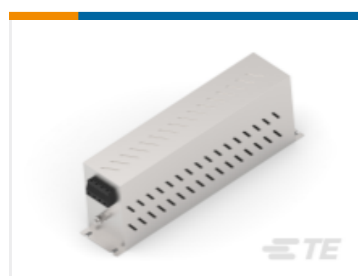
TE 产品编号2-1609998-3 KEV 42A 2S SP WYE BS 440VAC