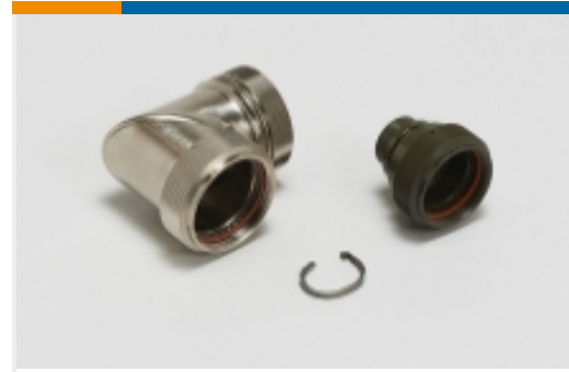
屏蔽后壳和适配器(1)