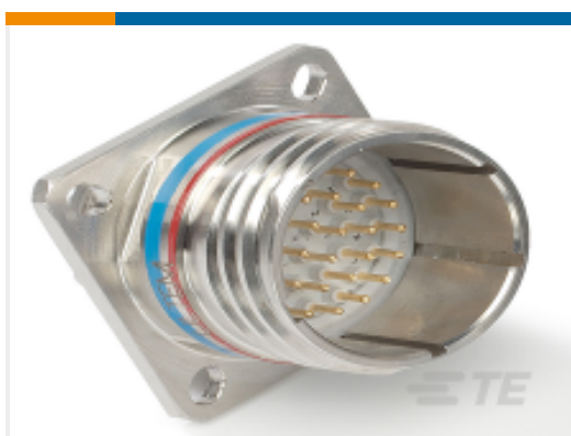
TE 产品编号YDTS20W25-29BAV001 RECP ASSY