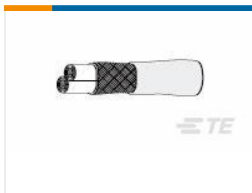
TE 产品编号3857203001 44A1121-24-2/4-9