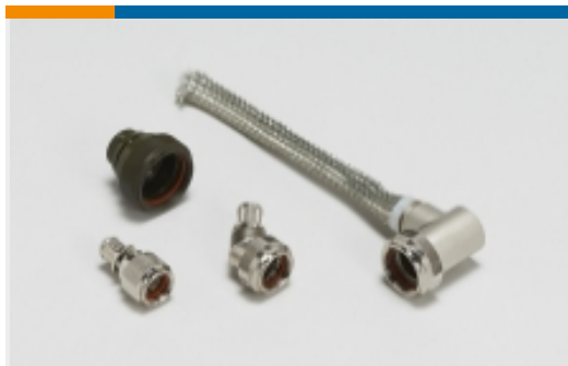
加固型后盖和适配器(2821)