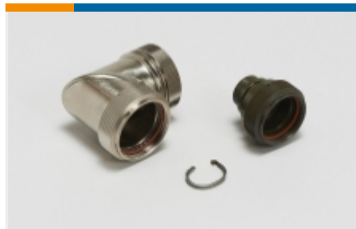
屏蔽后壳和适配器(1)