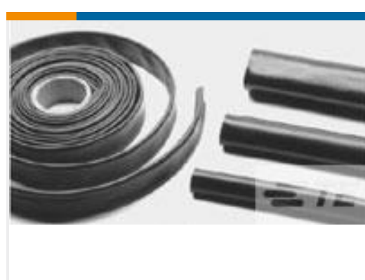
TE 产品编号CB5444-000 XFFR-30X25