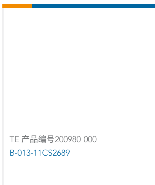
TE 产品编号200980-000 B-013-11CS2689