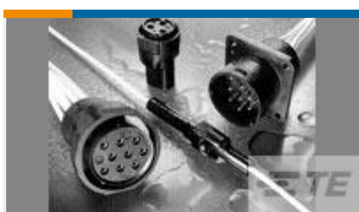
TE 产品编号207575-1 PLUG, 7 POS ECONOSEAL