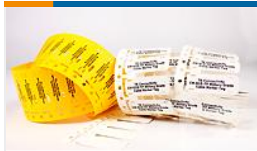
TE 产品编号E99238-000 HTCM-SCE-TP-1/2-4H-9