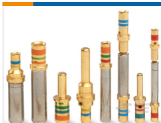
TE 产品编号0641-1-2031L CONT PIN