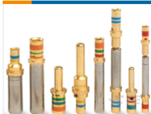
TE 产品编号12336-20 CONT IMP