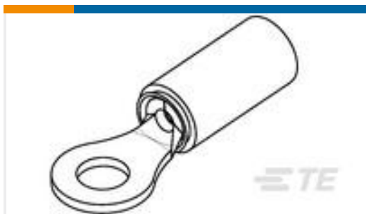
TE 产品编号1577631-1 TERMINAL RT PIDG PEEK STRATO 18-16 AWG