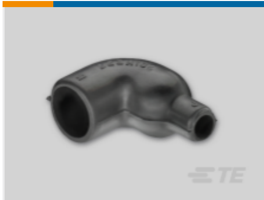
TE 产品编号117451-000 球形热缩护套：有嘴，直角