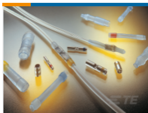
TE 产品编号4367320002 D-436-0148CS391