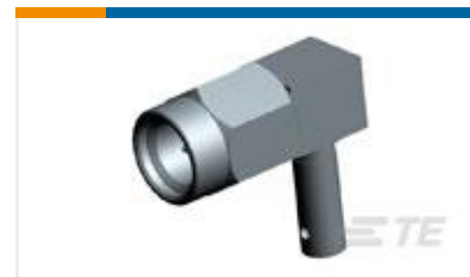
TE 产品编号1045507-1 SSMA R/A Cable Plug 1037 5001 00