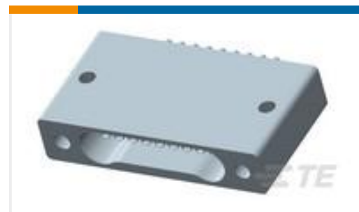
TE 产品编号2-1589457-9 SSM009SC2DC012N = WDUALOBE