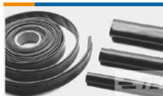
TE 产品编号CJ5694-000 BSTS-03X25