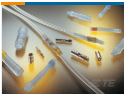
TE 产品编号479761-000 D-128-0055