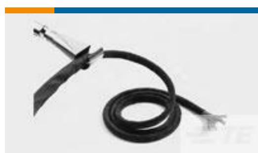
TE 产品编号CB7840-000 RW-200-5/8-0-SP