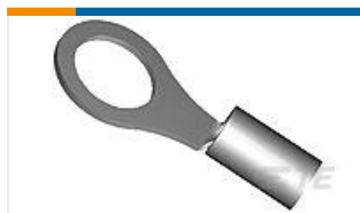
TE 产品编号322337 DIAMOND GRIP 16-14 HT R 8