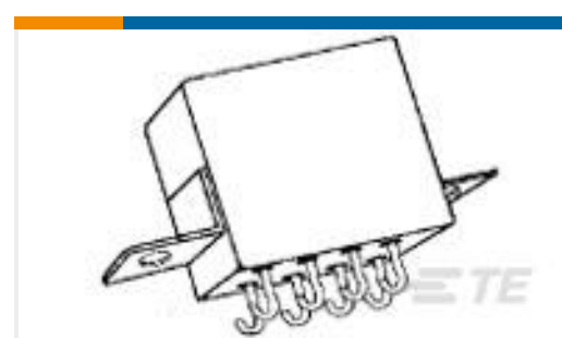
TE 产品编号5-1617758-2 FCB-205-0226M=M83536/2-026M