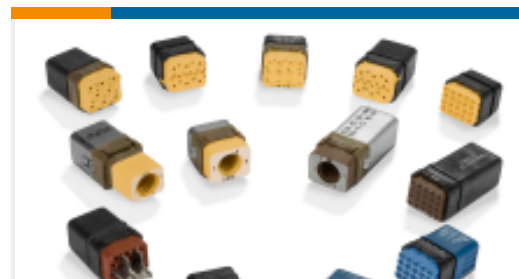
TE 产品编号ZPF00000000015262 DMC-M 12-20 BN