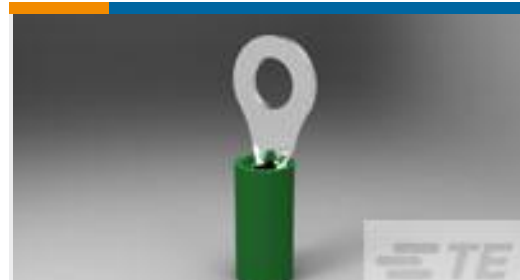
TE 产品编号50832 TERMINAL,PIDG PTFE R 22-20 8