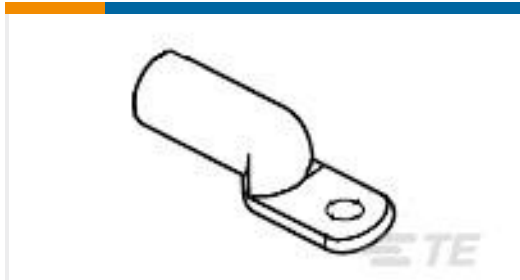
TE 产品编号277151-7 TERMINAL,COPALUM R 1/0 5/16