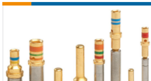
TE 产品编号12336-22 CONT IMP