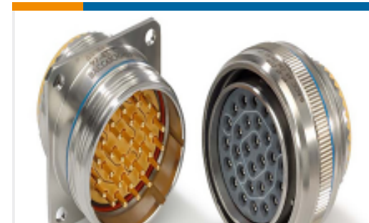
TE 产品编号ZPF10000000008141 983-6K 18-14 SN-L