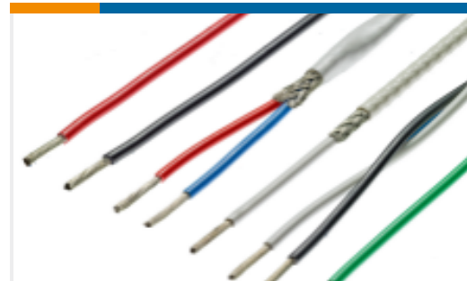
TE 产品编号3761793001 44A0121-26-0/1