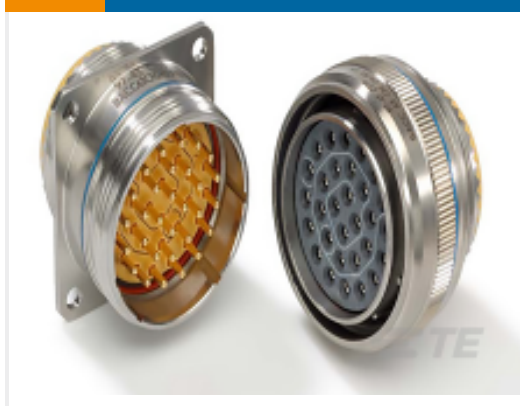
TE 产品编号 ZPF0000000000032946 983-ORS 20-16 SN-L