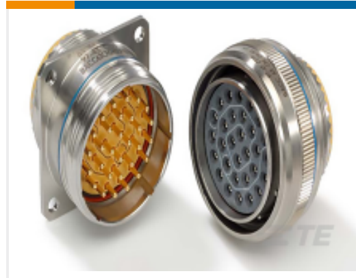
TE 产品编号 ZPF000000000007384 983-OS 16-10 SN-L