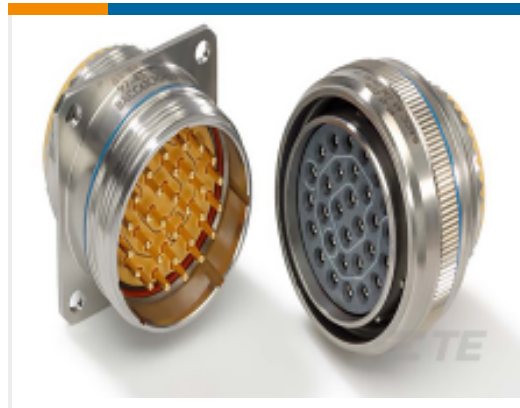
TE 产品编号 ZPF0000000000033567 983-OS 28-42 SN-L