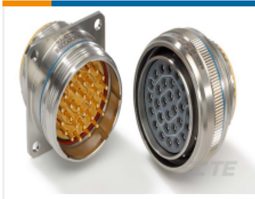
TE 产品编号 ZPF0000000000033247 983-OS 14-07 SN-L