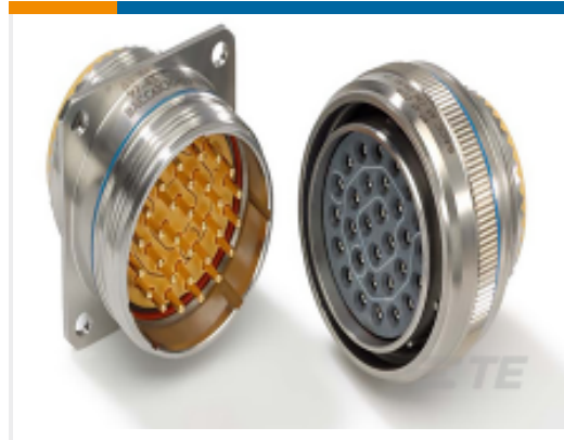
TE 产品编号 ZPF000000000007382 983-OS 16-10 S6 L