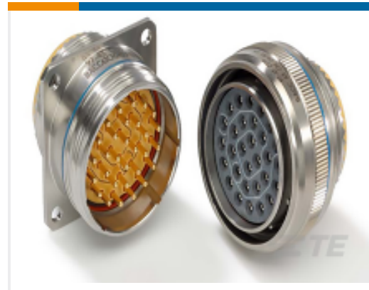
TE 产品编号 ZPF0000000000034222 983-OWS 18-14 SN-L