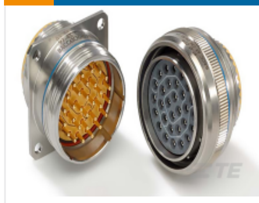
TE 产品编号 ZPF000000000007244 983-ORS 18-14 SN-L