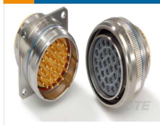
TE 产品编号 ZPF0000000000033202 983-OS 12-03 SN-L