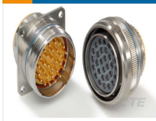
TE 产品编号 ZPF0000000000033047 983-ORS 22-19 SN-L