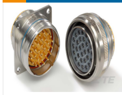
TE 产品编号 ZPF000000000007261 983-ORS 20-16 S8 L