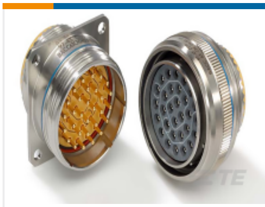
TE 产品编号 ZPF000000000008112 983-6K 14-07 S6 L