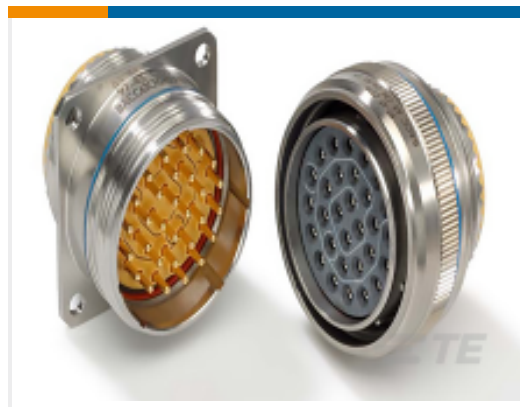
TE 产品编号 ZPF000000000008115 983-6K 14-07 SN-L