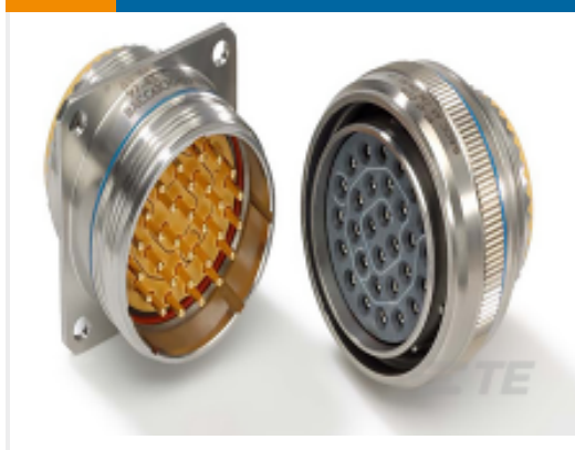
TE 产品编号 ZPF000000000007225 983-ORS 16-10 SN-L