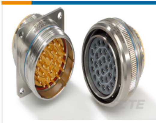
TE 产品编号 ZPF0000000000033559 983-OS 28-42 S6 L