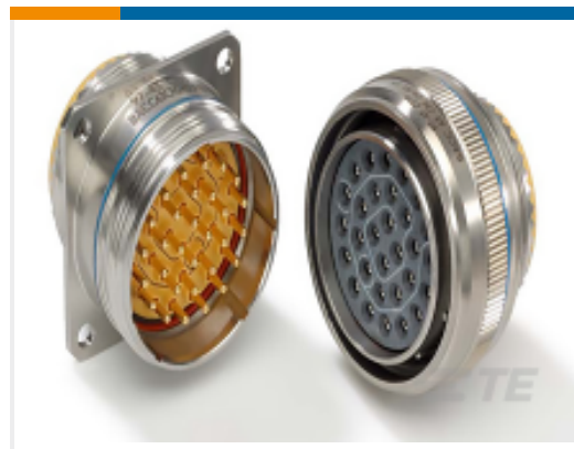
TE 产品编号 ZPF000000000007196 983-ORS 12-03 SN-L