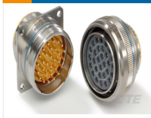
TE 产品编号 ZPF0000000000032939 983-ORS 20-16 S6 L