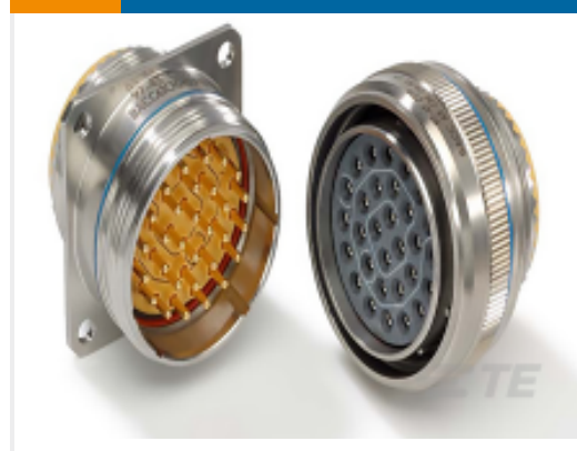
TE 产品编号 ZPF0000000000033083 983-ORS 24-30 SN-L