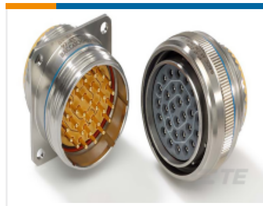
TE 产品编号 ZPF000000000007212 983-ORS 14-07 SN-L