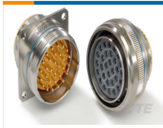
TE 产品编号 ZPF0000000000034167 983-OWS 16-10 SN-L