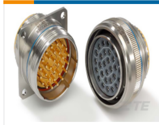
TE 产品编号 ZPF0000000000033344 983-OS 18-14 SN-L