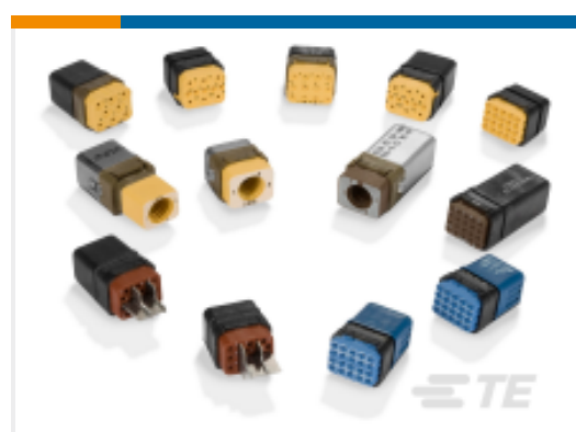
TE 产品编号ZPF000000000203708 DMC-M 99-10 PC