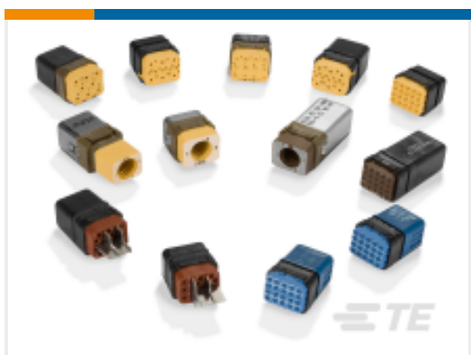
TE 产品编号ZPF00000000015141 DMC-M 01-08 AB