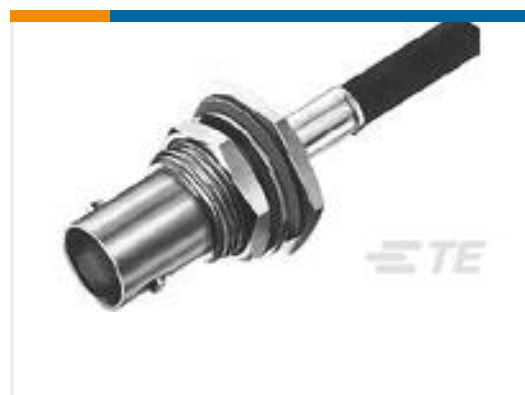
TE 产品编号225398-6 CONNECTOR, BNC DUAL CRIMP JACK