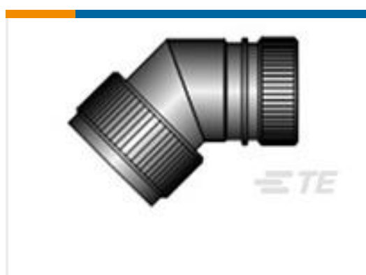
TE 产品编号CZ6862-000 HEX40-AC-45-25-A12-3