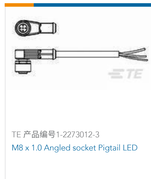
TE 产品编号1-2273012-3 M8 x 1.0 Angled socket Pigtail LED