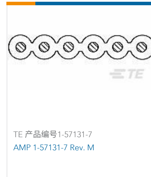
TE 产品编号1-57131-7 AMP 1-57131-7 Rev. M