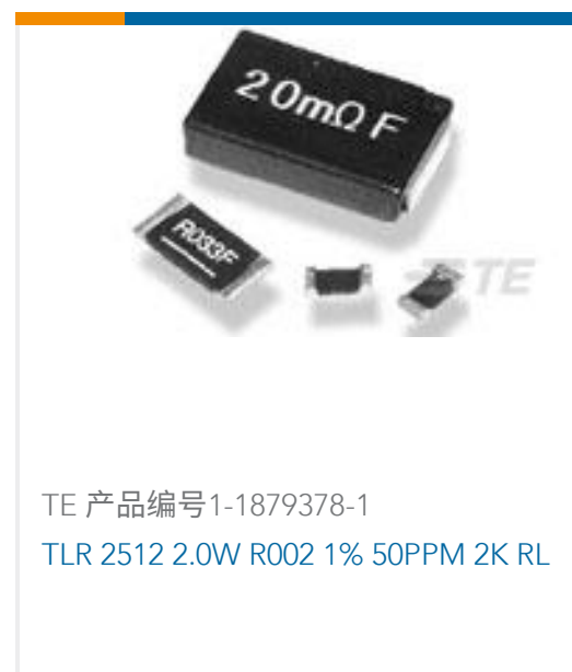
TE 产品编号1-1879378-1 TLR 2512 2.0W R002 1% 50PPM 2K RL