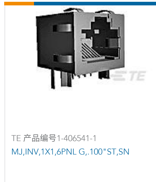
TE 产品编号1-406541-1 MJ,INV,1X1,6PNL G,.100"ST,SN