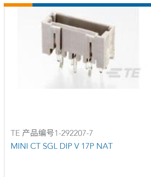
TE 产品编号1-292207-7 MINI CT SGL DIP V 17P NAT