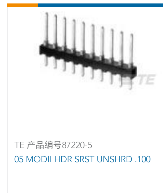
TE 产品编号87220-5 05 MODII HDR SRST UNSHRD .100