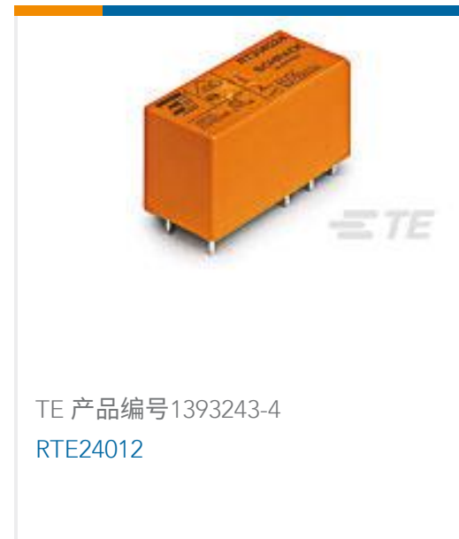
TE 产品编号1393243-4 RTE24012