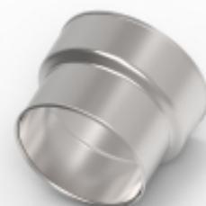
TE 产品编号1670813-1 EMC, CRIMP SLEEVE, IPT 70 - 12