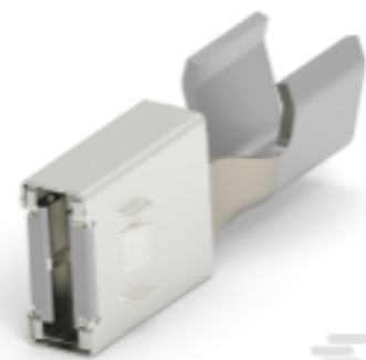
TE 产品编号1-2840575-2 PCON12,TERMINAL,FAM SLD/UNSLD