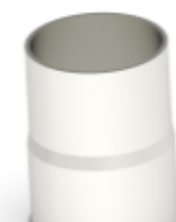
TE 产品编号2310222-1 CU ALLOY,INNER FERRULE,PCON12, 2P