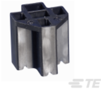
TE 产品编号 1-1904045-1 V23333Z0001A007-EV-100