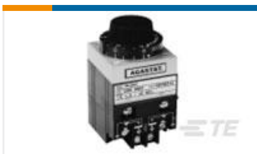
TE 产品编号1423183-2 7032ABB=RLY,STD,DBH,2P,120VAC,