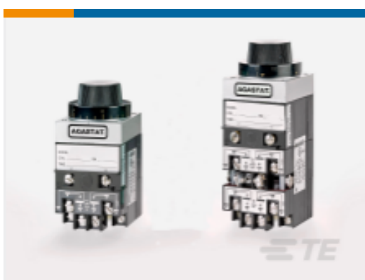
TE 产品编号 1-1423159-9 7012PB=RLY,STD,ON,2P,125VDC, 5