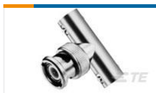
TE 产品编号221543-2 T-ADAPTER, SERIES BNC REPKG