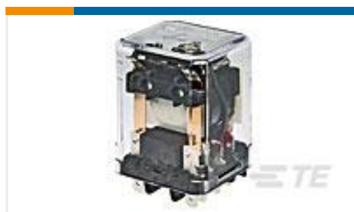
TE 产品编号1393114-5 KUEP-3D35-24=KU