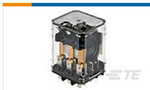
TE 产品编号1393118-8 KUP-14D11-110=KU