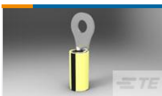
TE 产品编号35634 TERMINAL,PIDG R 16-14HD 6