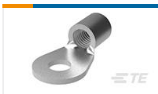
TE 产品编号320744 TERMINAL,SOLIS R 1/0 5/8